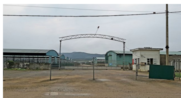
Trang trại bỏ hoang của Cty Bình Hà tại Hà Tĩnh.

Đến tháng 6.2018, tổng đàn bò còn 1.481 con, Cty tạm dừng nhập bò thịt vỗ béo. Đại diện Cty thừa nhận dự án chưa đạt được kết quả theo dự toán ban đầu. Cty Bình Hà đã có văn bản số 90/CV-BH- 23.4.2018 đề xuất UBND tỉnh, xin đưa ra khỏi quy hoạch 744,9ha, và xin bổ sung thêm hơn 448,7ha.