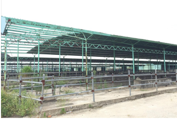
Trang trại bò sữa bỏ hoang của Cty Bình Hà tại Hà Tĩnh.